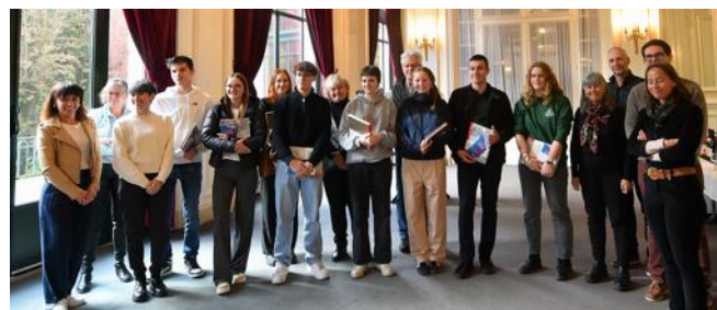
Une dizaine de jeunes Chamoniards, nés entre juin 2005 et avril 2006 et nouvellement inscrits sur les listes électorales, ont participé à cette cérémonie.

Une dizaine de jeunes de 18 ans nouvellement inscrits sur les listes électorales se sont vus remettre par les élus, leur carte d'électeur ainsi que le livret du citoyen, recensant les droits et devoirs du citoyen et les principes fondamentaux de la République.