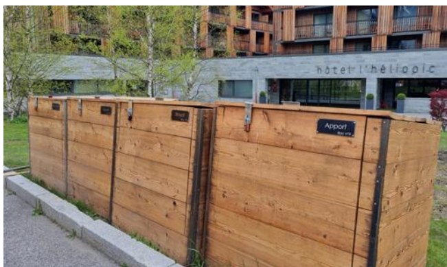
Un site de compostage partagé a vu le jour au pied du téléphérique de l'aiguille du Midi. Écotrivélo a formé les équipes de la Compagnie du Mont-Blanc et de l'Héliopic à sa bonne utilisation.

L'association qui collecte les déchets organiques à la force des cuisses n'a en effet pas les moyens de collecter tous les déchets des professionnels de la vallée et les encourage donc à retrousser leurs manches pour se mettre au compostage