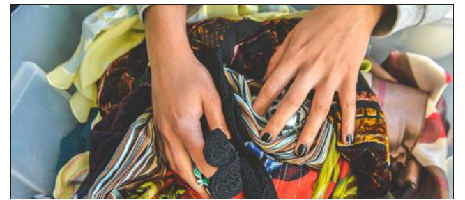
Vêtements, chaussures, jouets et articles de maison seront à dénicher dès 8 heures, ce samedi 6 août.

Le Secours populaire organise samedi 6 août une grande braderie. Une façon de déstocker les dons accumulés dans les locaux de l'association solidaire à but non lucratif qu'il faut rapidement vider avant que ne soient entrepris des travaux bienvenus. Un rendez-vous qui, grâce à l'altruisme et l'engagement de fidèles bénévoles, permettra aux curieux dénicheurs d'acheter vêtements, chaussures, jouets et quelques articles de maison à un prix minimal, puisque tout sera proposé à un euro. Les biens vendus proviennent des dons faits à l'association qui les trie tout au long de l'année avant de les ranger par catégorie pour les ressortir lors de ce genre de braderies. L'occasion pour les plus démunis et les autres de trouver de quoi s'habiller pour pas grand-chose et de financer par la même occasion d'autres actions solidaires. Tout un chacun sera accueilli par l'équipe du Secours populaire dès 8 heures au gymnase des Pèlerins. Les acheteurs auront jusqu'à 16 heures pour faire leurs emplettes.