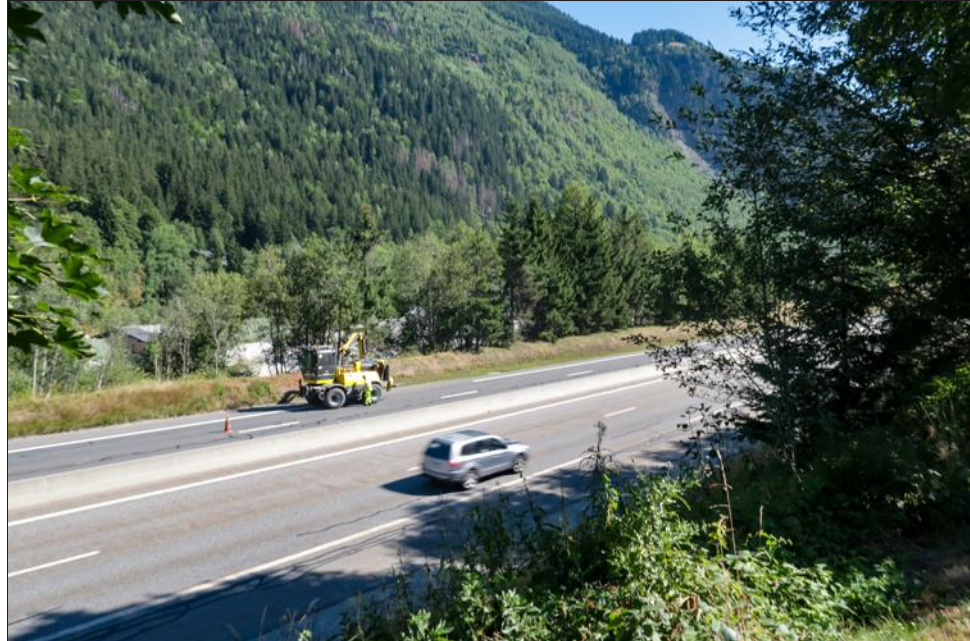
Le projet envisagé par Autoroutes et tunnel du Mont-Blanc porterait sur la portion de la Route Blanche située au niveau de l'hôtel Saint-Antoine.

Justement, la société Autoroutes et tunnel du Mont-Blanc (ATMB) souhaite ériger un mur antibruit au niveau de l'hôtel Saint-Antoine afin de diminuer les nuisances générées par le trafic. L'entreprise veut, dans le cadre de son programme